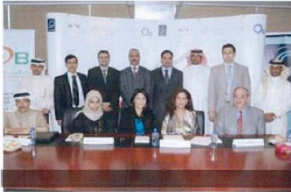
• خلال المؤتمر الصحافي

الباد - الممر الاقتصادي: تبدأ فعاليات أسبوع رواد الأعمال العالمي الأسبوع المقبل، الذي تقيمه منظمة القيادات العربية الشابة فرع البحرين بالتعاون مع شركة O2 للاتصالات التسويقية، وشركة زين للاتصالات، وبنك البحرين للتسويق، وستواصل فعاليات أسبوع رواد الأعمال العالمي في الفترة من 16 وحتى 22 من شهر نوفمبر الجاري وتتضمن العديد من المبادرات التي ينفذها نخبة من رواد الأعمال الذين سيعرضون قصص نجاحهم أمام الشباب ويقدمون نماذجهم لرواد الأعمال الجدد على كيفية مواجهة التحديات التي قد تعترض سبيلهم في أثناء حياتهم العملية.