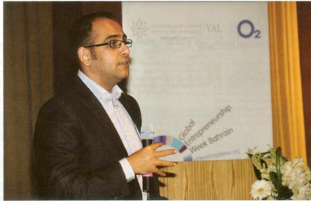
الجهاني - أسبوع رواد الأعمال يستهدف الشباب في قطر من 77 دولة