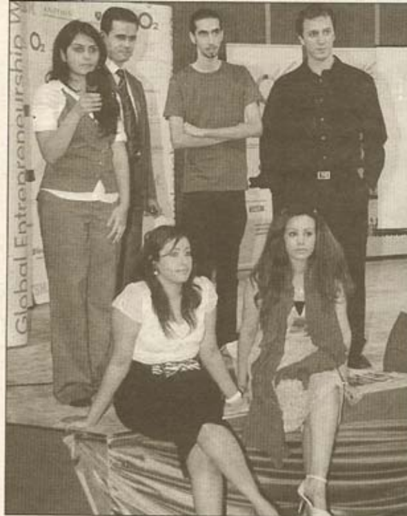
■ Students taking part in the event